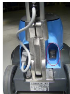
schakelaar dubbele snelheid