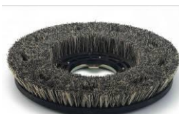
Coco borstel 00242