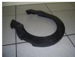
Gewicht 10 kg 14110