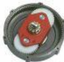
Dubbel planetaire overbrenging